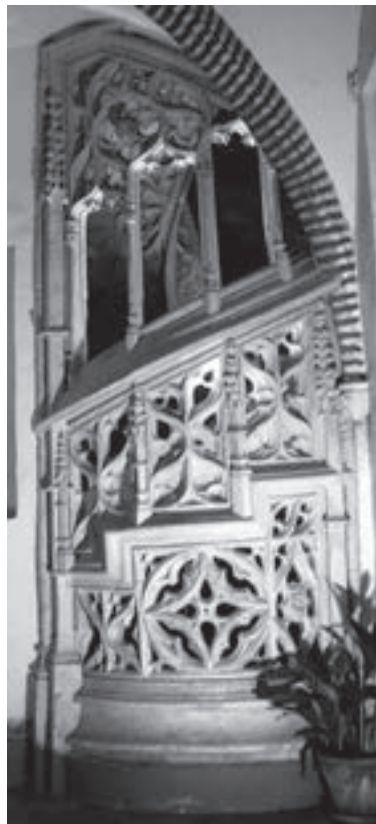
Fig. 3.- De izquierda a derecha y de arriba abajo: (3.a) Escalera de la antigua mezquita de la Xara (Simat de la Valldegina) en la actualidad. Fotografía de Joaquín Bérchez (3.b) Escalera de acceso a la tribuna de los músicos de la sala noble de la casa del Arte Mayor de la Seda (Valencia). (3.c) Escalera de la sala capitular del monasterio de San Jerónimo de Cotalba (Alfauir) vista desde el interior. Fotografía de Carlos Martínez. (3.d) Escalera de la sala capitular del monasterio de San Jerónimo de Cotalba (Alfauir) vista desde el claustro. Fotografía de Carlos Martínez.