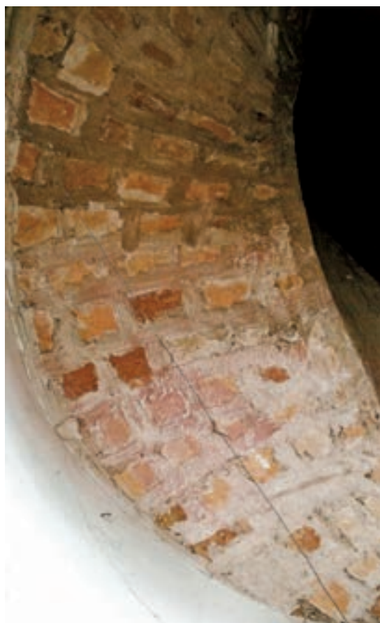
Fig. 8.- Escaleras de acceso a las cubiertas del antiguo monasterio de Santa Clara (Játiva) edificadas en el siglo XVIII. La imagen de la derecha muestra el aparejo tabicado por hiladas transversales de su helicoide.