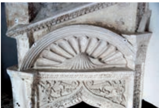
Fig. 4.- Arriba, motivos decorativos tallados en yeso en el antepecho de la escalera de la casa del Arte Mayor de la Seda (Valencia). Abajo, motivos decorativos tallados en yeso en el antepecho de la escalera del dormitorio del monasterio de Santa Clara de Játiva.

dextrógiro dos vueltas completas. Está formado por un tabicado de una sola hoja con un simple trasdosado de yeso muy irregular en el que asientan unos peldaños de 65 cm de amplitud. Su reducido espesor queda especialmente patente en este caso al carecer de una terminación adecuada en el borde interior. A diferencia de otros ejemplos, que poseen un zócalo formado por un encintado o un baquetón, aquí se optó por una solución mucho más simple consistente en el encuentro en inglete de las tabicas con el intradós del helicoide. Esta opción, usada tam-