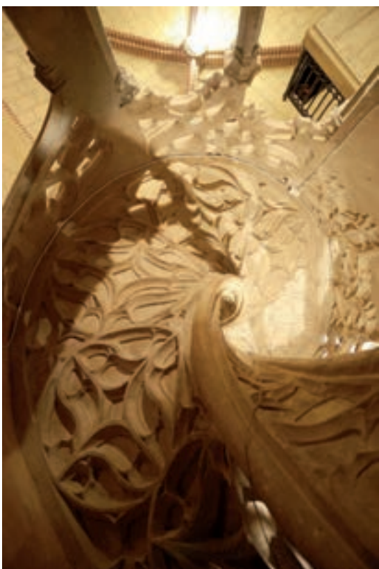
Fig. 5.- Arriba, escalera del arruinado castillo-palacio de Bolbaité, compuesta por sillares prefabricados de yeso, antes de las recientes obras de consolidación. Abajo, detalle de la talla en yeso del trasdós de la escalera de la sala capitular del monasterio de San Jerónimo de de Cotalba (Alfauir).

Su helicoide se solucionó con una bóveda tabicada que descansa en los muros perimetrales y en una estructura frontal de paneles tal vez macizos de yeso. Se sospecha de la presencia de elementos leñosos en el núcleo de yeso. Su alzado está ordenado por pilastras con capiteles de hojas de acanto, ábacos y pequeñas rosetas, que ascienden por tramos escalonando los distintos frentes. Cada uno de sus planos presenta vanos rematados con frontones triangulares y curvos alternados que alojan arcos conopiales. Los netos llevan insertada decoración al romano , asociadas con formas a la moderna . Los frentes apilastrados de los soportes y de las cornisas están compuestos por unas piezas prefabricadas con molde 12 superpuestas mientras que el resto de elementos decorativos descritos fueron tallados manualmente. Estos mismos moldes fueron empleados para realizar la portada de yeso existente junto a su desembarco.