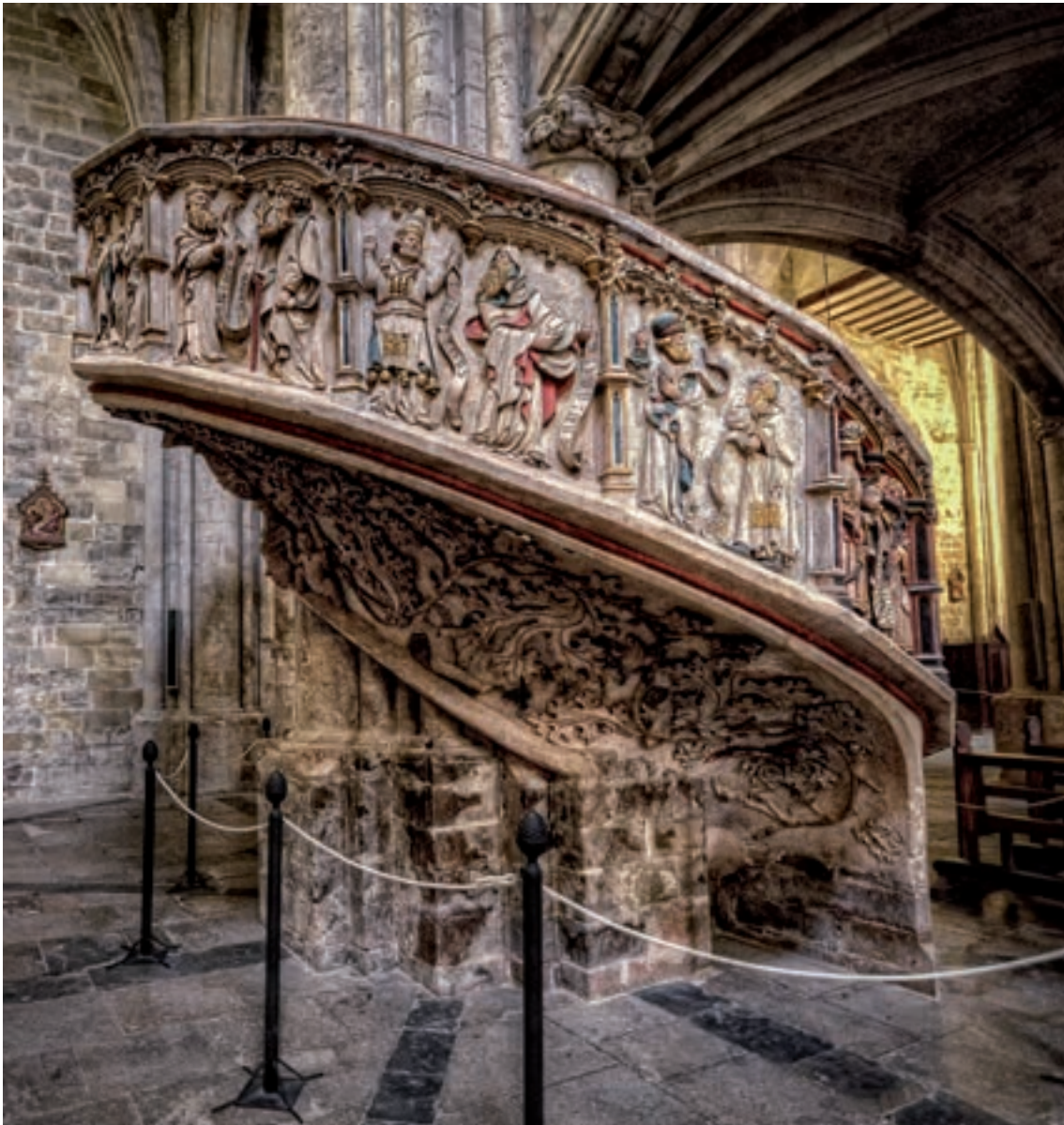
Fig. 1.- Escalera del coro de la Iglesia de Santa María de Morella (1406-1426).

de yeso endurecido cuenta en su interior con una celosía o viga triangulada de madera y metal que dota de mayor estabilidad al conjunto. Lo más llamativo es que esta compleja solución se emplaza en una comarca que solo había conocido anteriormente construcciones de piedra. La utilización de uno o varios zunchos de hierro